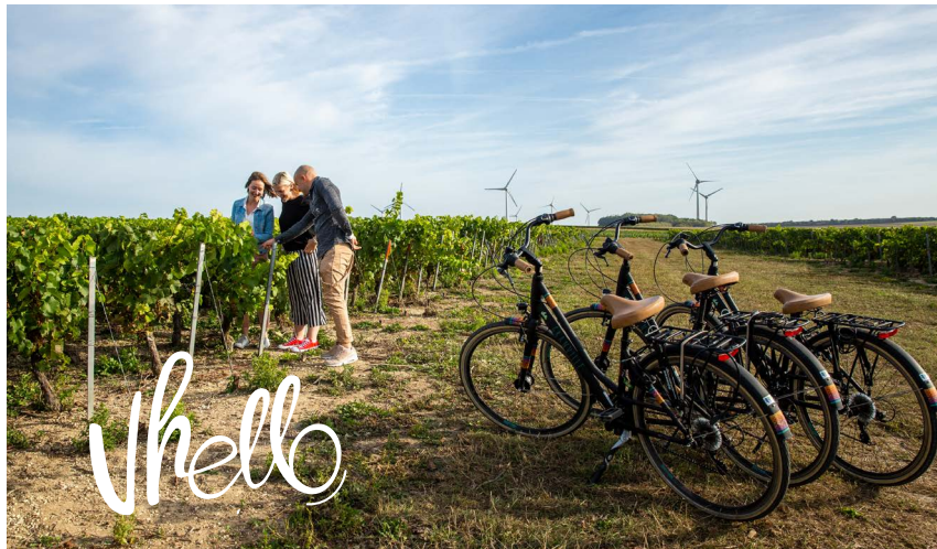
Mise à jour graphique : Angelo Vullo